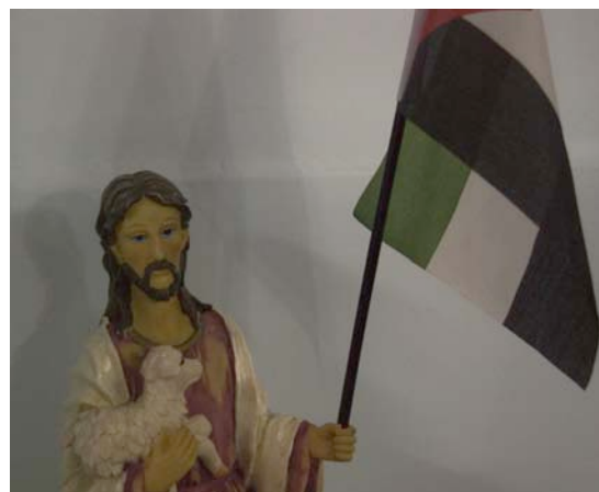
Jesus med palestinaflagga och det bortsprungna lammet i pingstkyrkan i Betlehem.

-Ja, jag tror att Kristus kom med ett budskap om rättvisa och fred. Kristus favoriserade inte ett folk framför andra.