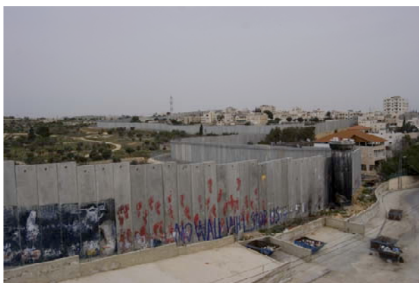
Delar av den mur som omger stora delar av Betlehem och isolerar flera orter på Västbanken.