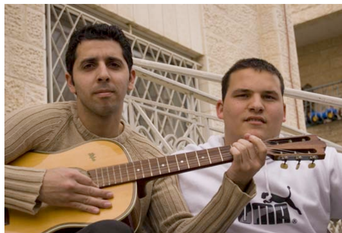
Studenter vid Bethlehem Bible College

-Betlehem är helt beroende av turism. Och antalet turister har minskat mycket sedan muren och den nya checkpointen byggdes. De israeliska myndigheterna säger åt turisterna att inte åka till Betlehem, därför att det är farligt. Det är en lögn, och man säger att palestinierna är farliga för turister. Och vi har aldrig varit farliga för turister. Den ekonomiska situationen har lidit enormt av detta.