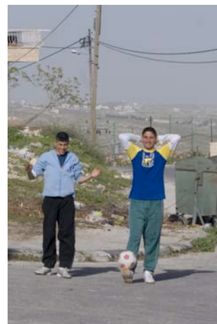
Unga killar i Betlehem

-Israelerna beordrar då palestinier att städa upp vägen. Så, mina vänner och jag spelade fotboll, jag var yngst. Eftersom jag var yngst behövde jag inte delta i uppröjningsarbetet. Jag var ju barn, så jag flabbade åt mina vänner eftersom de var