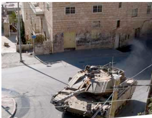
Utsikt från Pingstkyrkan under den senaste belägringen.

-Den mentala stressen är värre än den fysiska. När vi upplevde Betlehems belägring så hade vi utgångsförbud i 40 dagar. Vi fick gå ut för att gå ärenden en gång per vecka. Jag kunde inte åka till arbetet. Jag kommer ihåg att jag tog hem många böcker från biblioteket och började skriva min uppsats.