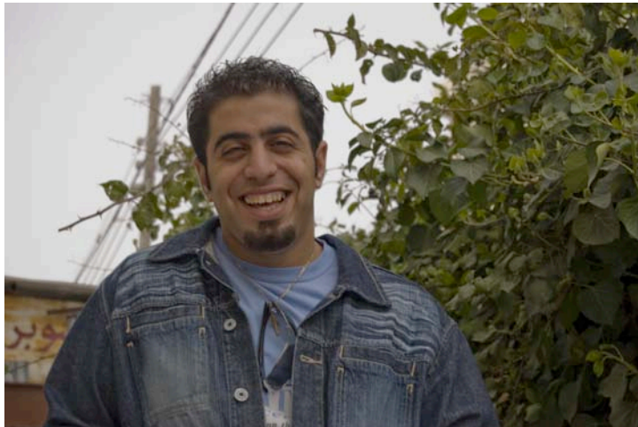
Student vid Bethlehem Bible College