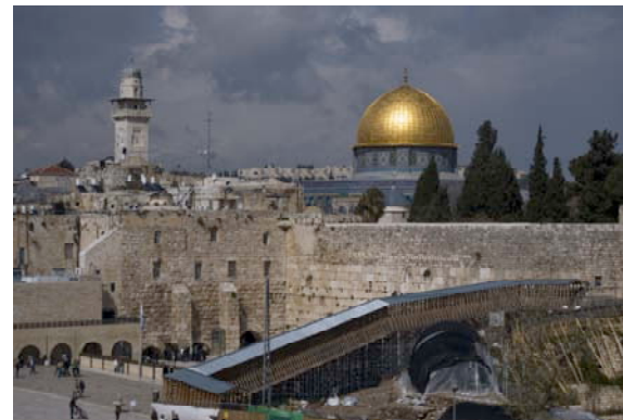
Västra muren i gamla stan.

-Jag kommer inte att lämna Jerusalem. Jag föddes här. Men sen vet jag inte var Jerusalem kommer att hamna.