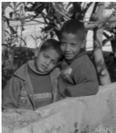
Barn i Betlehem